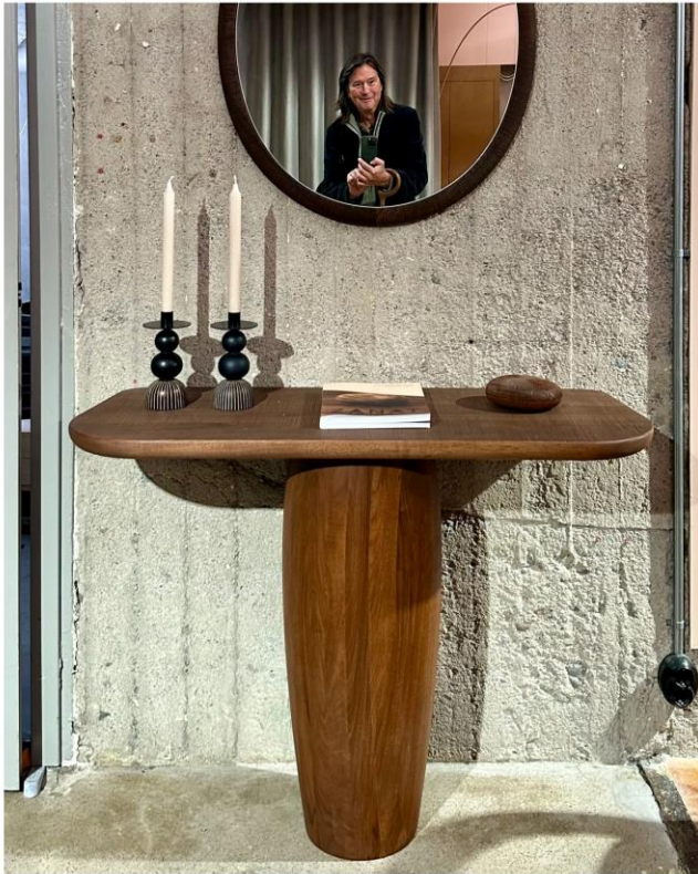
En högst (o)frivillig selfie – igen ...