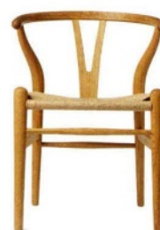
CARL HANSEN & SON Wishbone chair, sedia in versione kid