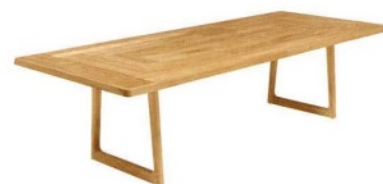
MOLTENI&C Fairmount, tavolo in legno da giardino