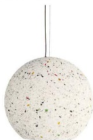
DIESEL LIVING/LODES Reglobe, sospensione recycled