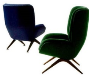
ARPER Lepal, poltrone con base in legno o metallo