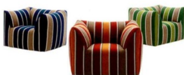
B&B ITALIA Le bambole, poltrone in tessuto da outdoor