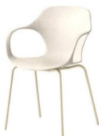
CONNUBIA Opsl, seduta in polipropilene riciclato