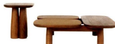
ZANAT Sinya, tavolini da caffè in legno con varie forme