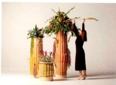
DESIGN SPACE ALULA Living pots, serie di vasi in cellulosa