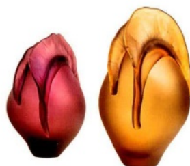
MICHELA CATTAI Corolla, vasi in vetro soffiato a mano