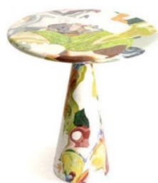
DIRK VAN DER KOIJ Melting pot, tavolo in plastic waste