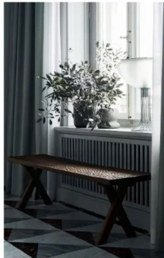
Kontrasterna ger magi. Ilse Crawford's bänk för Zanat blir ett värmande träinslag mot det mönstrade marmorgolvet.

– Familjen tycker om lugna färger så vi tog fram en palett med blått och grönt som löper genom hela lägenheten, berättar Joanna, som också följde upp konceptet genom att använda naturliga och mjuka material, som handsyddas gardiner i ull och ett kök i varmtonat trä. >