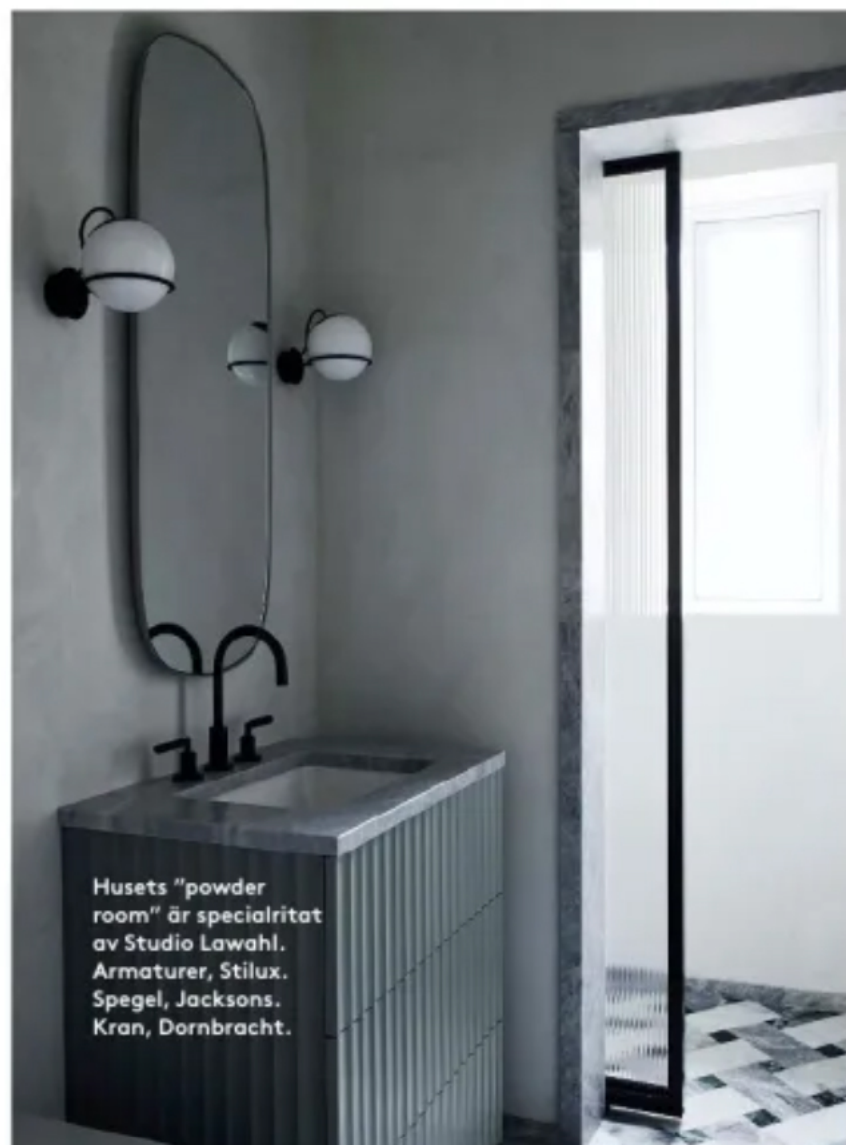
Husets "powder room" är specialritat av Studio Lawahl. Armaturer, Stilux. Spegel, Jacksons. Kran, Dornbracht.